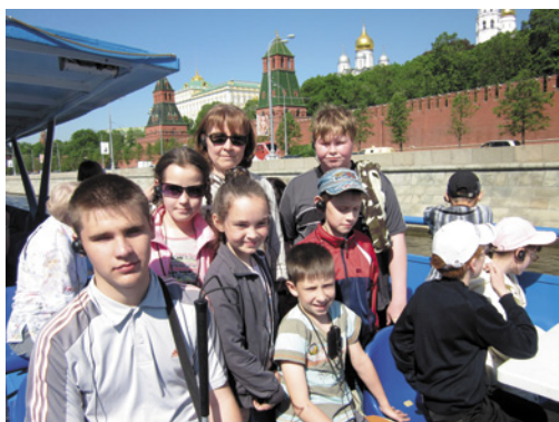
Рис. 6 – Ученики Якшур-Бодьинской школы-интерната (Респ. Удмуртия) на речной прогулке по Москве-реке