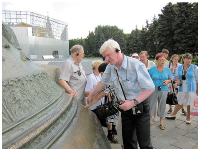
Рис. 5 – Туристы из РО ВОС Южно-Сахалинска на пешеходной экскурсии по московскому Кремлю

За пять лет реализации программы с Москвой познакомились 1073 инвалида по зрению из Башкирии, Татарстана, Карелии, Южно-Сахалинска, Саратова, Мурман-