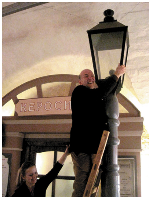
Рис. 2 – Директор музея Гомера Альдо Грассини на экскурсии в музее «Огни Москвы»

Очень важно в экскурсии для слепых и слабовидящих посетителей задействовать различные органы чувств: обоняние, осязание, слух, вкус. Во время экскурсии можно использовать аудиозаписи или продемонстрировать предметы, которые могут звучать: патефон, часовые механизмы и т. д. Важно задействовать и зрение. К сча-