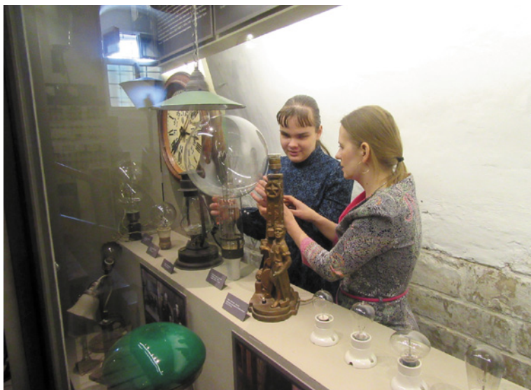
Рис. 1 – Слепые посетители могут осматривать экспонаты в музее «Огни Москвы» с обратной стороны витрины

В своей практике мы часто сталкиваемся с тем, что люди, не имеющие опыта общения со слепыми и слабовидящими людьми, считают, что проблемы со зрением влияют на их интеллектуальное развитие. Это совершенно ошибочное мнение. Дети, имеющие проблемы со зрением (если, конечно, нет других заболеваний), обучаются в школах по общеобразовательной программе, многие из них поражают глубиной своих знаний, широким кругозором. Они стремятся к освоению окружающего мира и получению новых ярких эмоций. Единственное отличие от людей с хорошим зрением заключается в том, что слепые и слабовидящие люди осматривают окружающие нас предметы руками (рис. 1). Не трогают, не ощупывают, а осматривают. Поэтому во время общения с представителями данной экскурсионной группы не нужно подбирать особые сло-