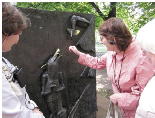
Рис. 7 – Туристы из РО ВОС г. Ярославля осматривают скульптуры на Патриарших прудах

ска, Ульяновска, Нижнего Новгорода, Челябинска, Омска, Смоленска, Тулы (рис. 6, 7).