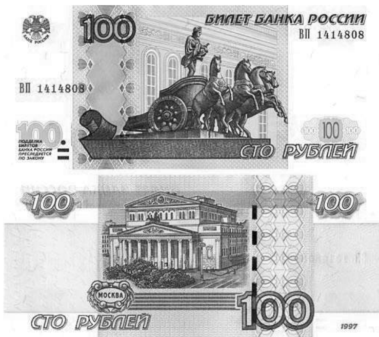
Здание Большого театра на купюре 100 рублей

украшает портик здания Государственного академического Большого театра (ГАБТ), на оборотной стороне изображен общий вид Большого театра в г. Москве.