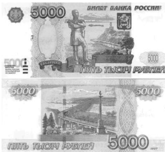
Достопримечательности г. Хабаровска на купюре 5000 рублей