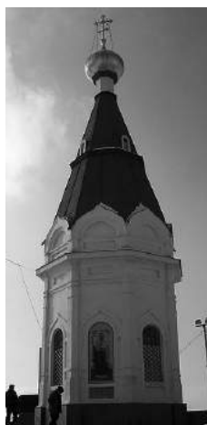
Достопримечательности г. Красноярка на купюре 10 рублей