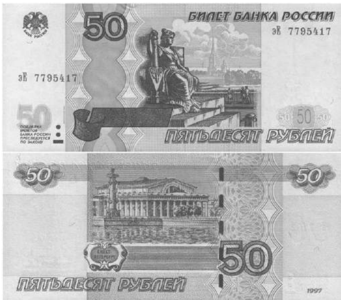
Памятные места г. Санкт-Петербурга на купюре 50 рублей

На лицевой стороне купюры 50 рублей изображена скульптура «Нева» на фоне Петропавловской крепости. Скульптура, олицетворяющая р. Неву, располагается на Биржевой площади Санкт-Петербурга у основания Ростральной колонны. Она создана скульптором Самсоном Сухановым и представляет собой женскую фигуру, сидящую на троне. «Ростральные колонны в Санкт-Петербурге на Стрелке Васильевского острова созданы в 1810 г. архитектором