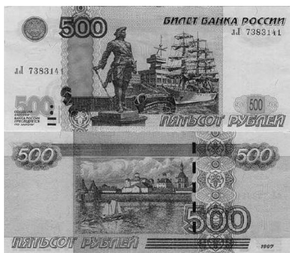
Памятник Петру Первому и вид на Соловецкий монастырь на купюре 500 рублей

На лицевой стороне 1000 рублей на фоне Ярославского кремля изображен памятник Ярославу Мудрому. На оборотной стороне купюры – церковь Иоанна Предтечи в г. Ярославле и вид на колокольню. Памятник Ярославу Мудрому стоит на площади Богоявления – центральной площади Ярославля. Монумент был создан скульптором О. Комовым в 1993 г. Ярослав Мудрый держит в одной руке меч, в другой — макет будущего города. Церковь Иоанна Предтечи в Толчкове — это один из наиболее известных памятников ярославской архитектуры, является памятником истории и культуры федерального