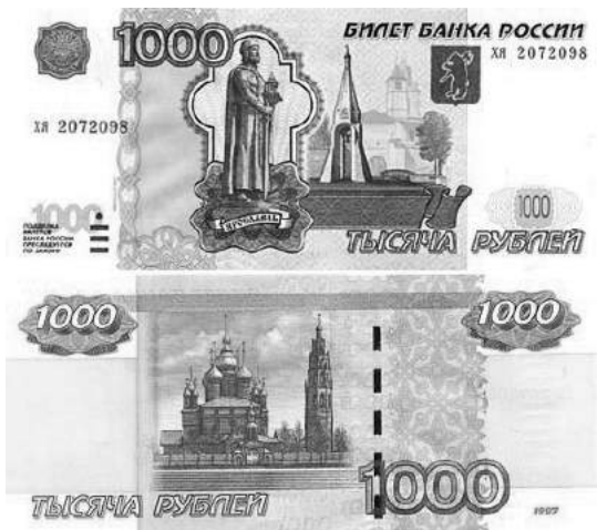
Памятник Ярославу Мудрому и Церковь Иоанна Предтечи на купюре 1000 рублей