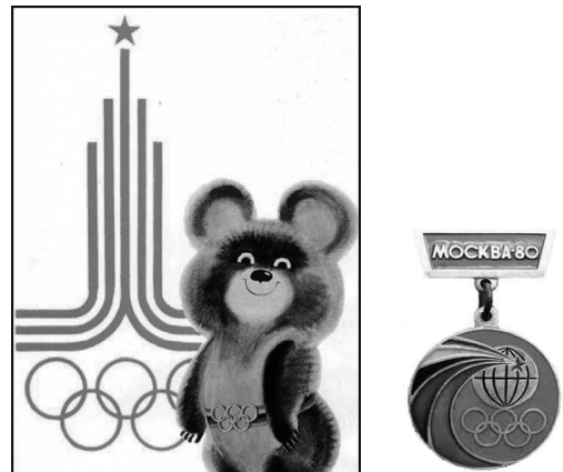
«Олимпиада-80» и социальное развитие

Превращение Москвы в олимпийскую столицу выразалось не только в строительстве отдельных спортивных объектов, но и решалась масштабная градостроительная задача — создание «Олимпийского города».