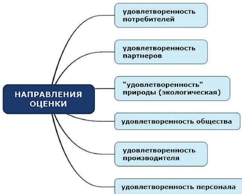
Рис. 1 – Основные направления оценки качества туристской продукции

С системных позиций [6, 8, 12], оценка качества туристской продукции должна опираться не только на потребительскую оценку, но и другие направления, основные из них представлены на рис. 1. Непосредственно критерии оценки с позиции потребителей представлены на рис. 2, которые и являются целевым ориентиром исследования.