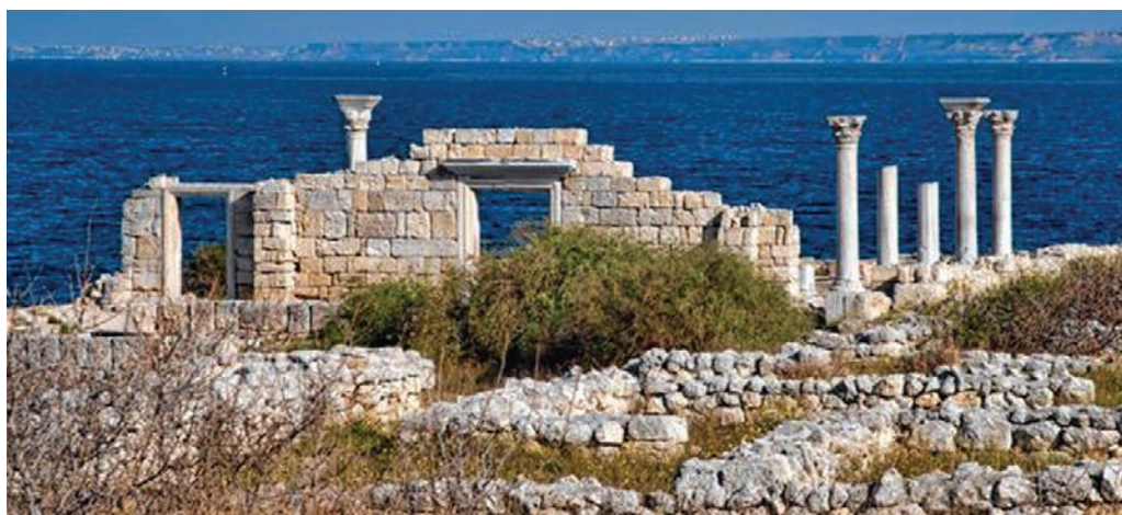
Херсонес Таврический и его Хора — памятник Всемирного наследия ЮНЕСКО